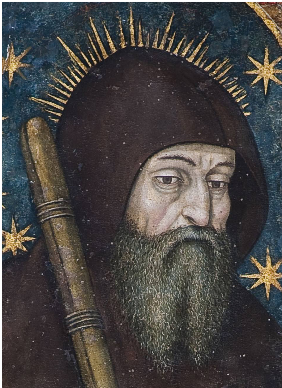
Francesco di Paola 1416 - 1507. Santo taumaturgo, patrono della Calabria, nel quinto centenario della canonizzazione 1519 - 2019