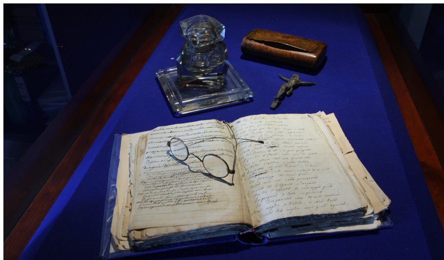
Oggetti appartenuti a Vincenzo Padula

a cura della Fondazione Vincenzo Padula di Acri (Cs)