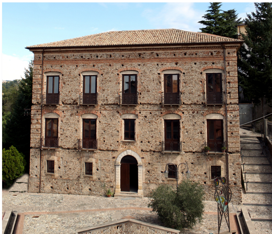
Palazzo Padula ad Acri (CS) Sede della Fondazione Vincenzo Padula