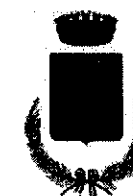
Comune di Pietrapaola