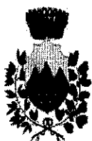
Comune di Calopezzati