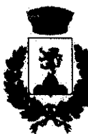
Comune di Mandatoriccio