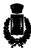
Comune di Crosia