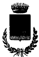
Comune di Bocchigliero