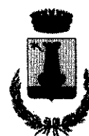
Comune di Terravecchia