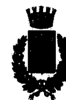
Comune di Rossano