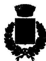
Comune di Cropalati