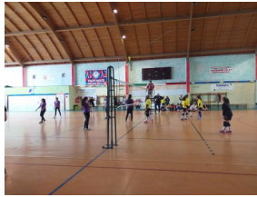
Volley - 1° e 2°GRADO