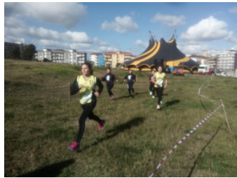
Corsa Campestre 1° e 2°