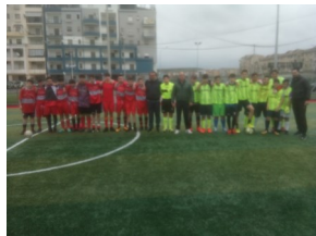
Calcio a 5 - 2° GRADO