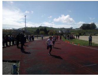
Triathlon Corri, Salta e Lancia 1°