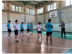
Basket 3x3 1°- 2° GRADO